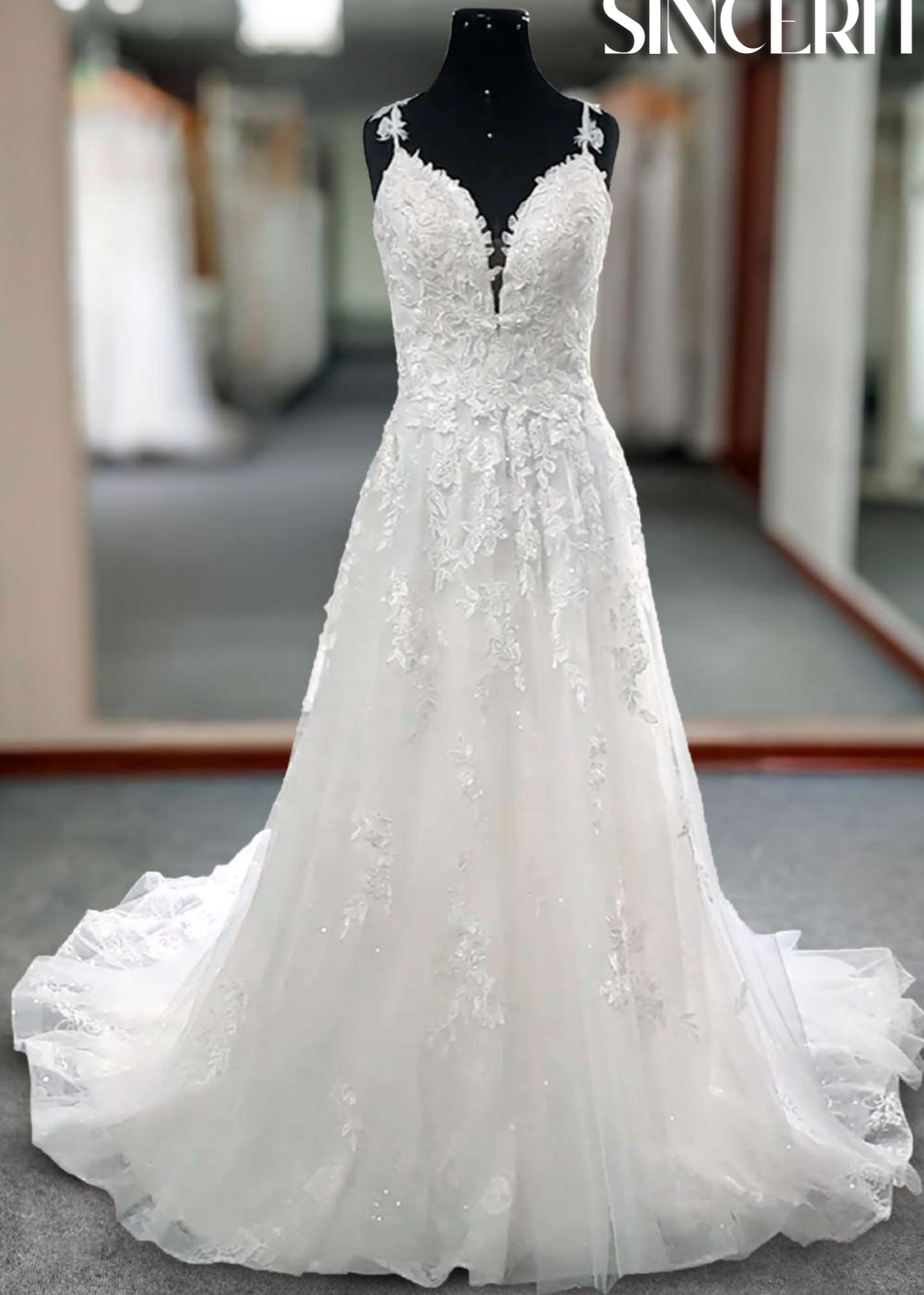
Vestido ajustado con un precioso escote ondulado, tirantes ilusión y una silueta decorada con maravillosas rosas que envuelven el diseño y se funden con la cola de tul.