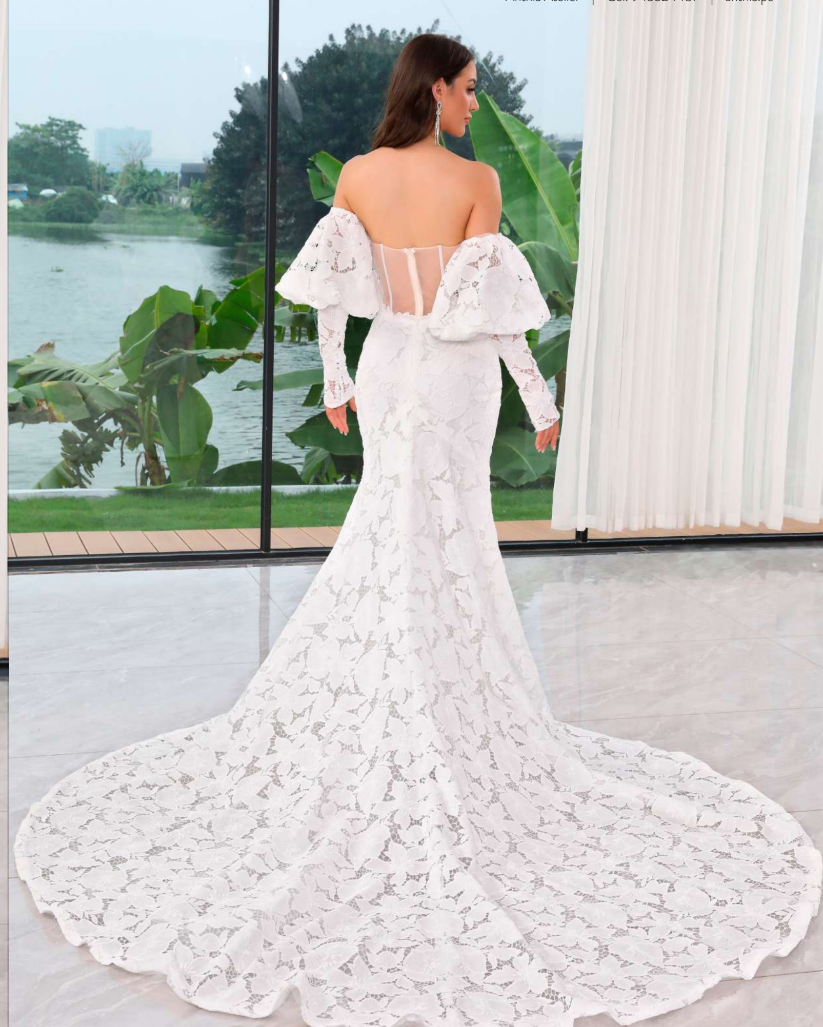
Vestido de novia de corte sirena con un estilo elegante y delicado, elaborado con un encaje texturizado. Se completa con un escote corazón y mangas desmontables tipo boho.