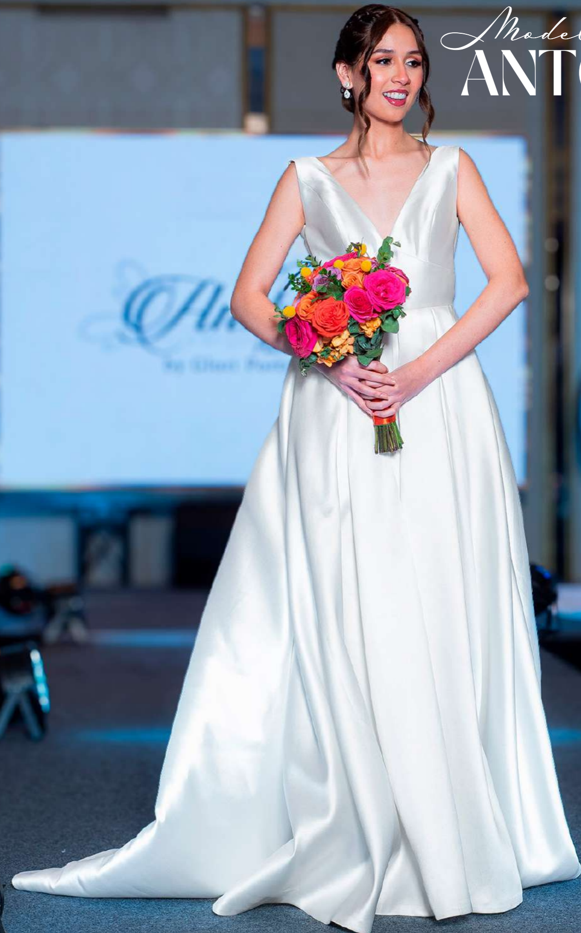
Vestido de novia en línea A con elegante falda de raso español que aporta estructura y caída impecable. El corpiño, sin mangas y con escote en "V", está adornado con delicadas aplicaciones de pedrería. Un diseño ideal para novias que buscan un estilo clásico con toques de brillo refinado.