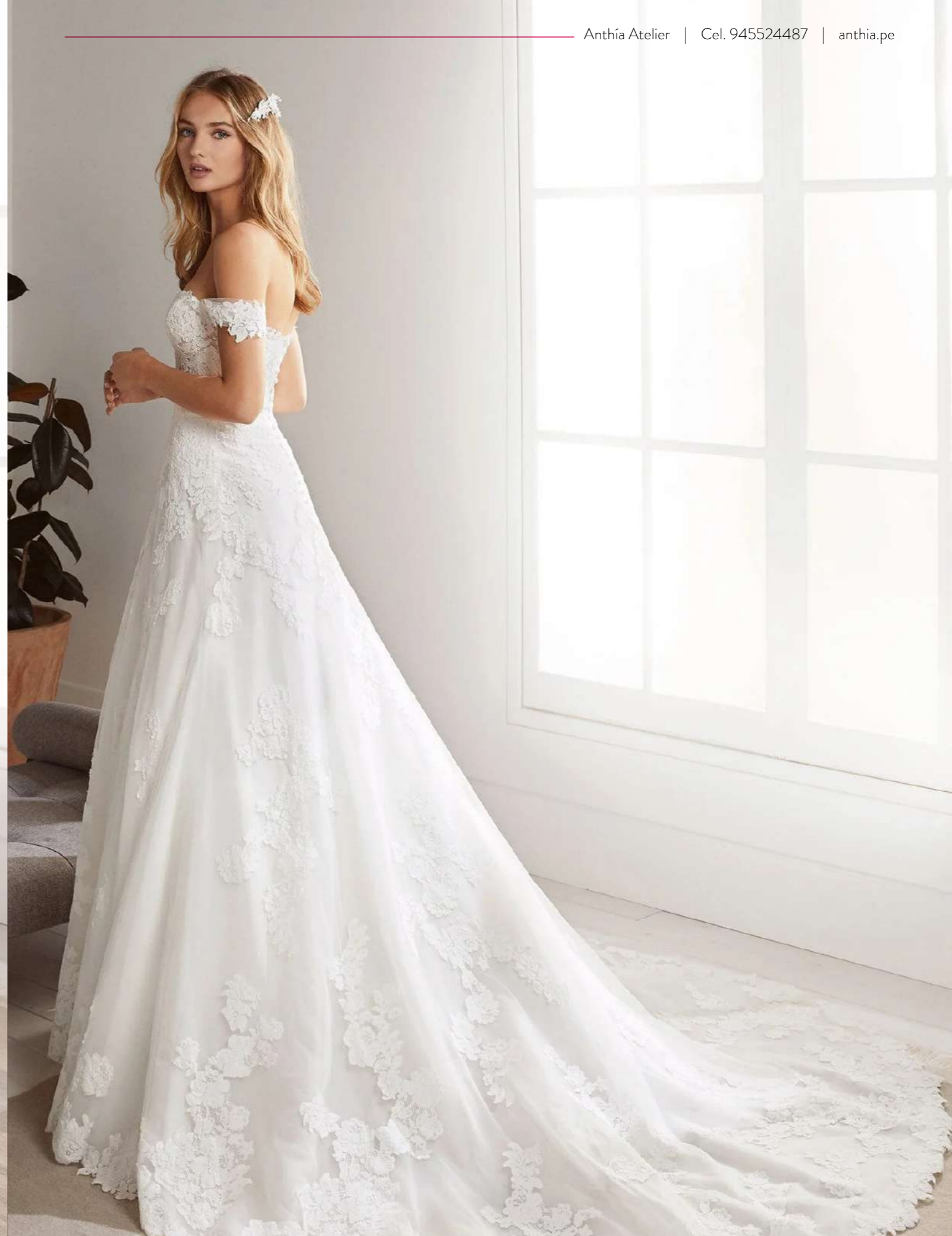
Clásico vestido corte en A con mangas caídas y románticas, aplicaciones de encaje floral integral. Presenta un escote corazón y una escultural costura.