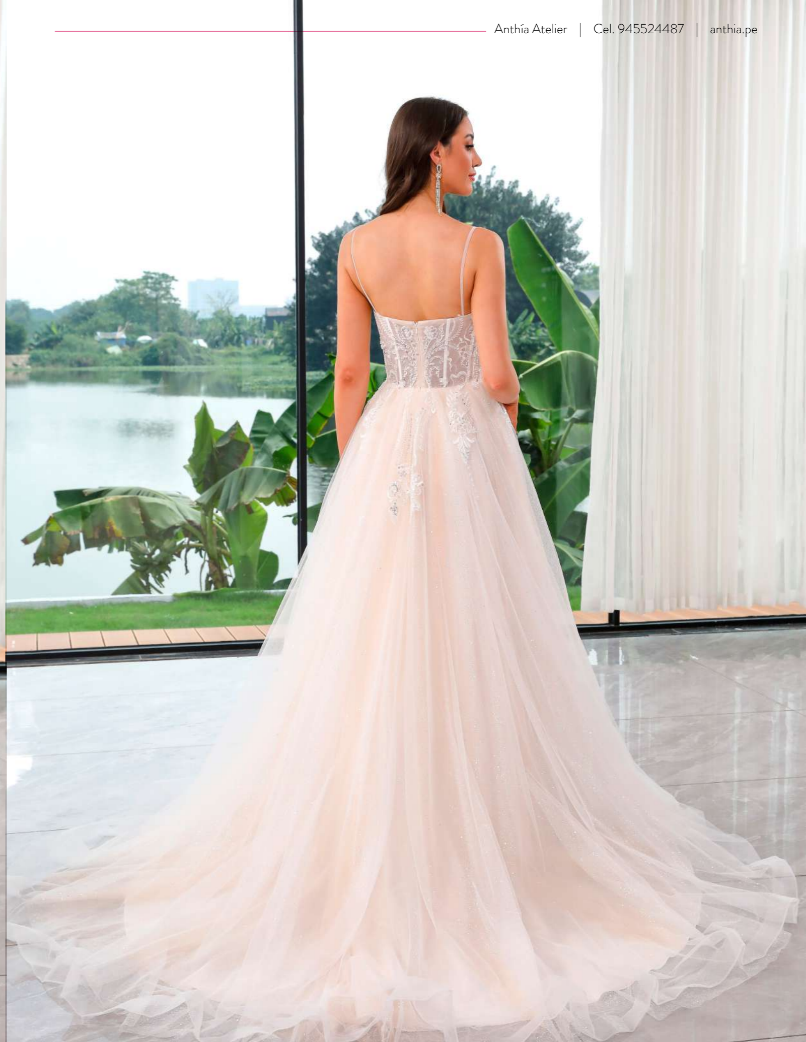
Vestido de novia en corte A y estilo romántico, elaborado con tul enriquecido con encaje y pedrería. Con escote corazón, presenta tirantes decorados con pedrería y una falda con abertura lateral, un modelo delicado y sensual.