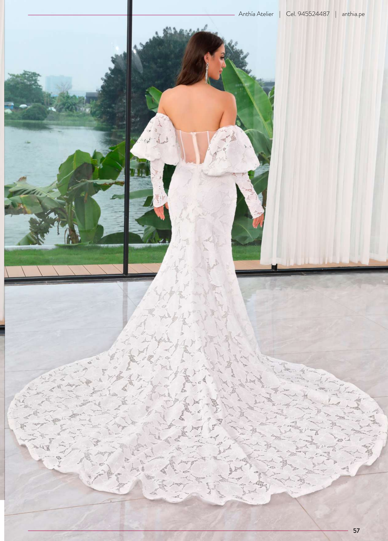
Vestido de novia de corte sirena con un estilo elegante y delicado, elaborado con un encaje texturizado. Se completa con un escote corazón y mangas desmontables tipo boho.