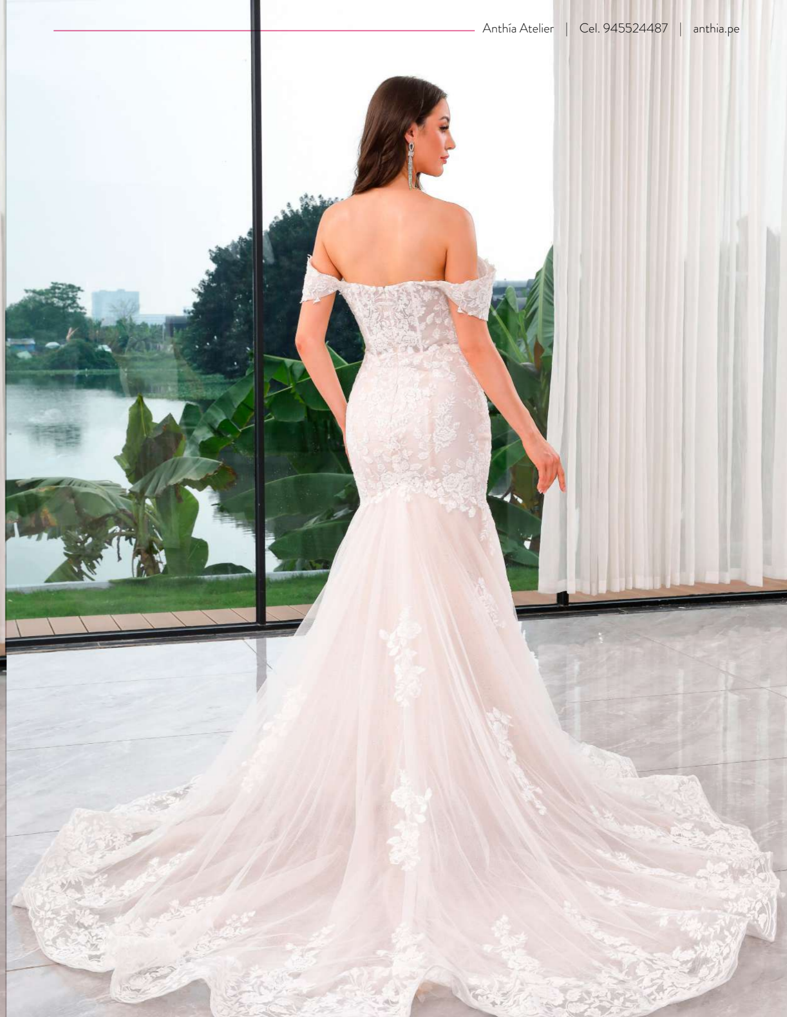
Vestido de novia, de corte semi-sirena con un estilo sensual. Está elaborado con encajes y un brillo sutil. Se completa con un escote en forma de corazón y unas manguitas caídas.