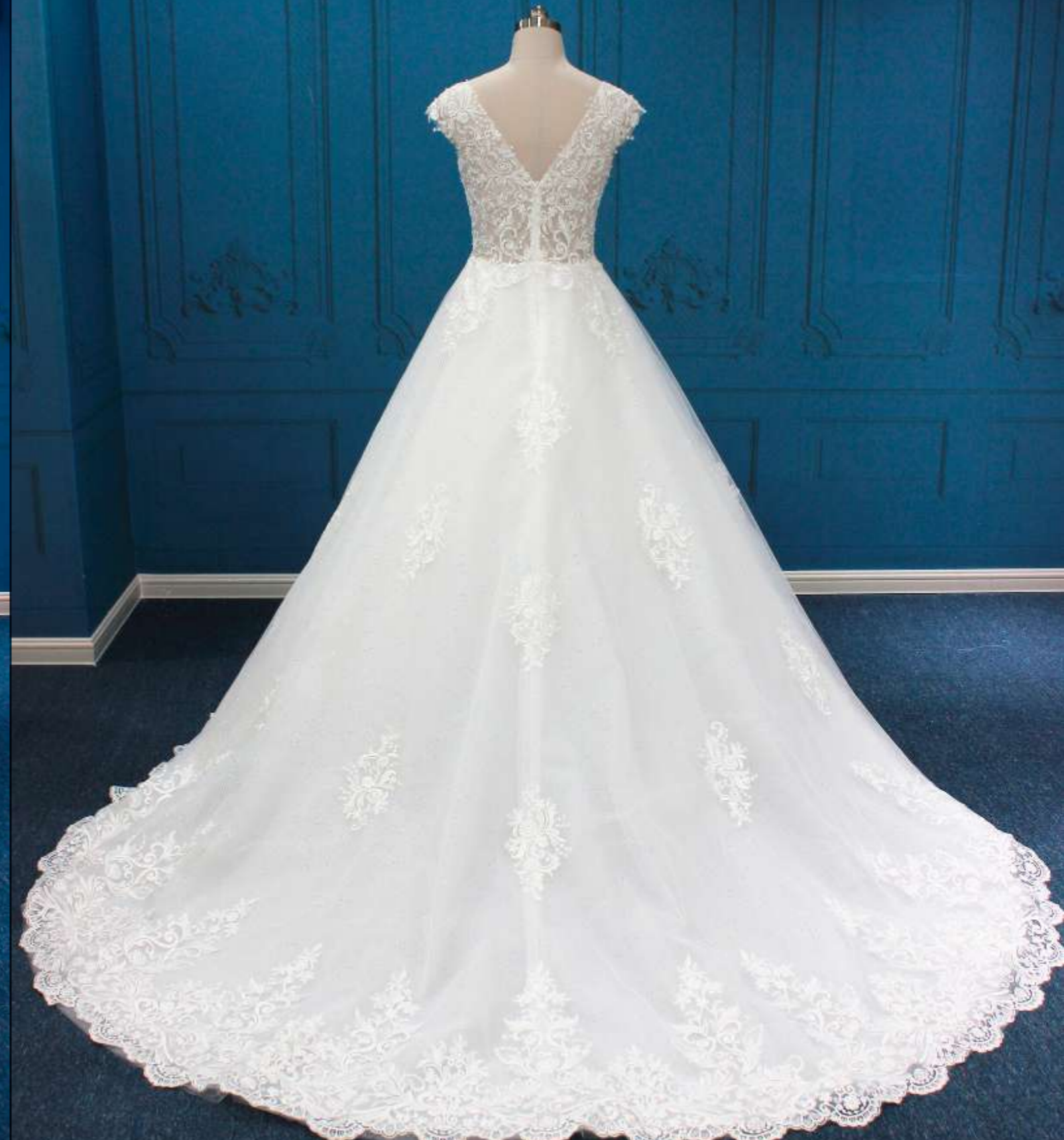
Vestido corte A con escote profundo y hombros caídos, confeccionado en encaje con motivos de flores y hojas que aportan un acabado romántico y elegante.